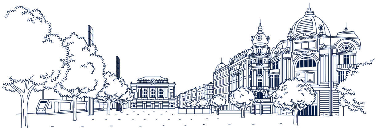
Plaza Comédie, Montpellier